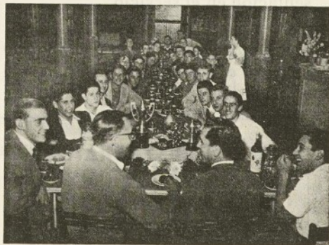
Aspecto de la Fiesta

En la citada fiesta fué obsequiado por los miembros de la Agrupación y demás jugadores de fútbol con un artístico regalo, que se le entregó