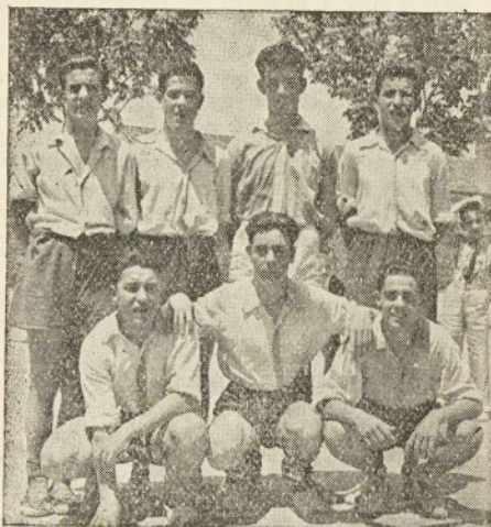
Equipo de Balón a Mano de la Agrupación Olímpica.

El próximo domingo, día 27, dará comienzo el IV Campeonato Local de Peñas organizado por Balón a Mano Granollers, en el campo del C. D. Granollers Esperamos de nuestro vocal la máxima competencia en la preparación del siete de la A. O. a fin de convertirlo en uno de los mejores equipos de este torneo que tan disputado se presenta.