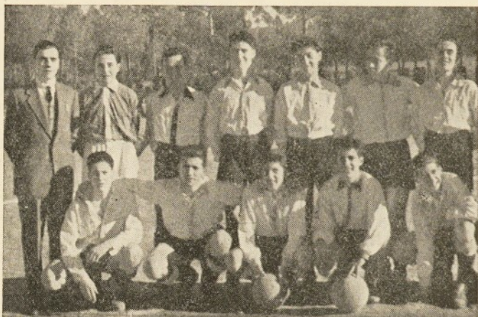
Nuestro equipo de fútbol, reforzado.