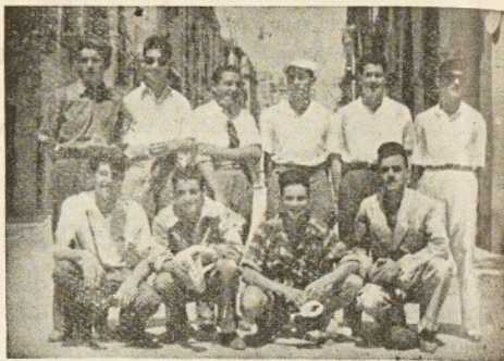
Grupo de olímpicos en San Feliu

Así el grupo de OLIMPICOS, que en número de diez, como se ve en la foto adjunta, nos desplazamos durante seis días en excursión a San Feliu de Guixols vivimos unas jornadas alegres a la par que ejemplares, pues si bien es verdad que nuestra alegría se esparció por las calles y paseos de San Feliu, y nuestros cantos se dejaron oír en estas claras noches del mes de junio, a veces a horas un poco adelantadas, también es cierto que siempre procuramos no molestar a nadie, y nuestras bromas y «juegos» que de todo hubo, se departieron entre nosotros, y con las olas que nos acompañaron, nos hicieron pasar estos días en medio de la más agradable camaradería.