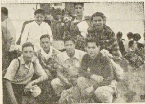
Grupo de Olímpicos en Matagalls

La A. Olímpica no podía faltar al homenaje que se rinde anualmente al gran hombre y gran Santo Catalán, San Antonio M. a Claret, y así un grupo de olímpicos—como puede apreciarse en la foto—, nos desplazamos a la cumbre de Matagalls para hacer ofrenda al Rdo. Padre de