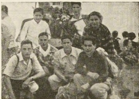
Grupo de Olímpicos en Matagalls

acto una magnífica audición de sardanas en Coll-Pregón y diferentes más actos. Este año nuestra Agrupación también ha estado presente en los actos mencionados por un grupo de olímpicos muy decididos.