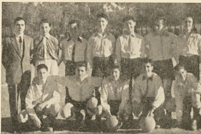
Nuestro equipo de fútbol, reforzado.