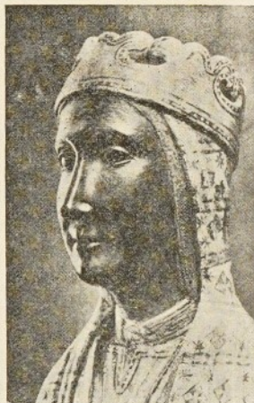
La «Moreneta», Patrona de la Agrupación

su existencia; y será muy distinta si el hombre no tuviese más norma de sus