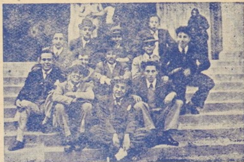
A Sòller cerquem un fons per l'Olimpic colossal i el trobem amb les escales de sa bella Catedral.