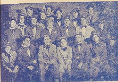
Actua en les Caramelles amb tanta superació que els seus cants de meravelles es recorden amb fruïció.