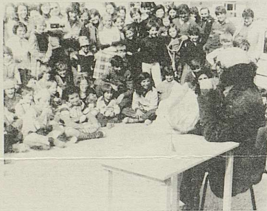
EL GRUP "SARGANTANA" EN UN MOMENT DE LA SEVA ACTUACIO

entès com a competició i violència, sinó el joc com a una participació de tots, aprendre a compartir allò que s'està fent i aprendre a valorar moltes coses que ens envolten: la natura fent excursions de descoberta, les festes populars, objectes que mai tenim en compte (uns talls de suro, una llauna buida per a fer un mòbil o bé un instrument musical,...)