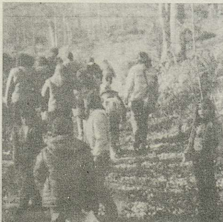
pujant cap al turó de l'home