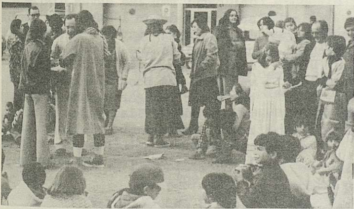
truites de botifarra i disfresses...