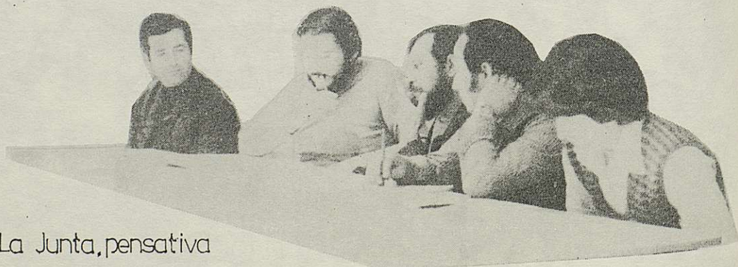
La Junta, pensativa