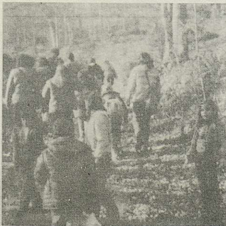
pujant cap al turó de l'home