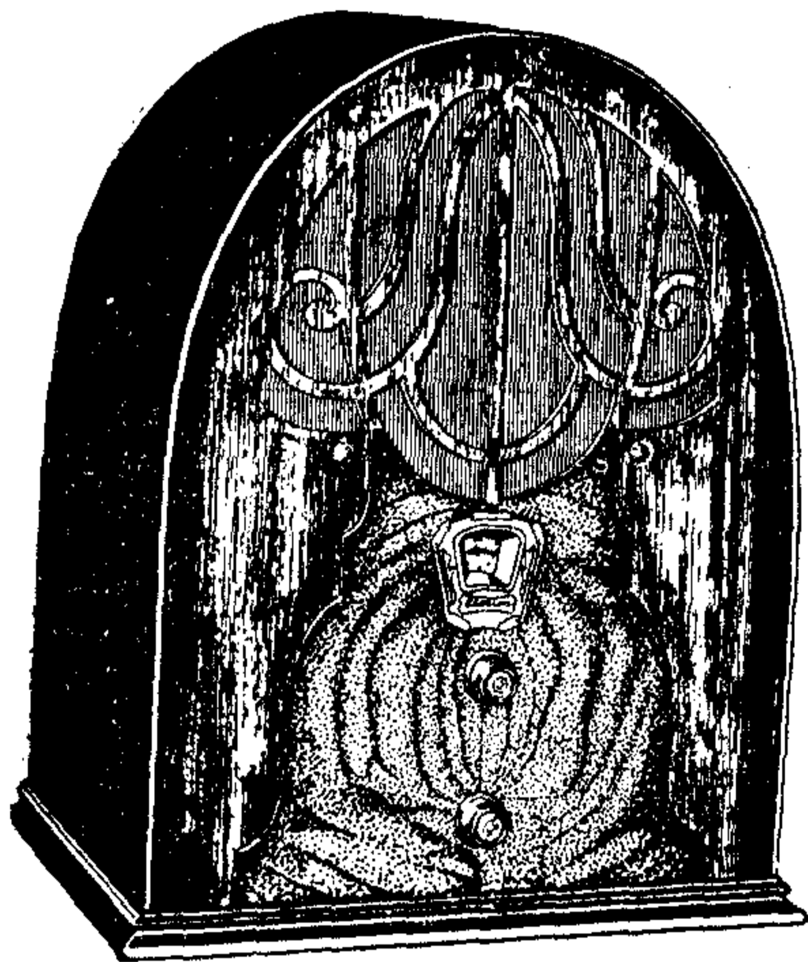
Model 40, de 5 vàlvules

Model 40 —Amb circuit Neutrodino ultra-modern a base de les vàlvules Multi-mu i Pentodo , dotat de tots els perfeccionaments i equipat amb el famós altaveu dinàmic TCA , amb 98 % de puresa de to.