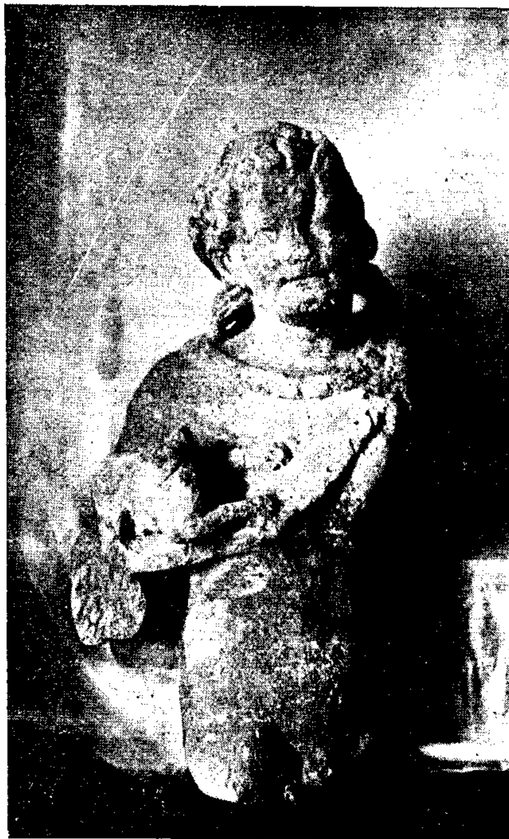
Els romans eren amics del benestar i de l'ornament de la casa. Una escultura romana de pedra trobada a la Torre de Marata

Tot això, amb les construccions suplementàries que comporta i amb les divisions que la casa deuria constar, portà una nova modalitat a l'habitació, ja que era un gust i una tècnica molt superior a la ibèrica. Aleshores apareixen també les teules, espècie de lloses planes de terra cuita amb un encaix per su-