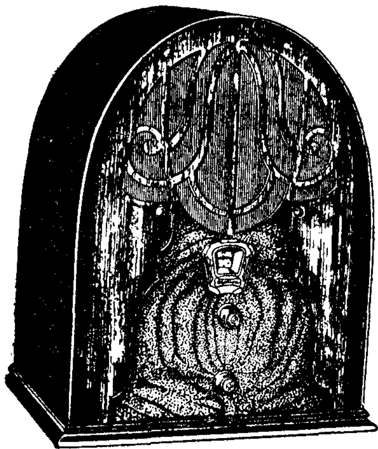
Model 40, de 5 vàlvules

Model 40 —Amb circuit Neutrodí ultra-modern a base de les vàlvules Multi-mu i Pentodo , dotat de tots els perfeccionaments i equipat amb el famós altaveu dinàmic TCA , amb 98 % de puresa de to.