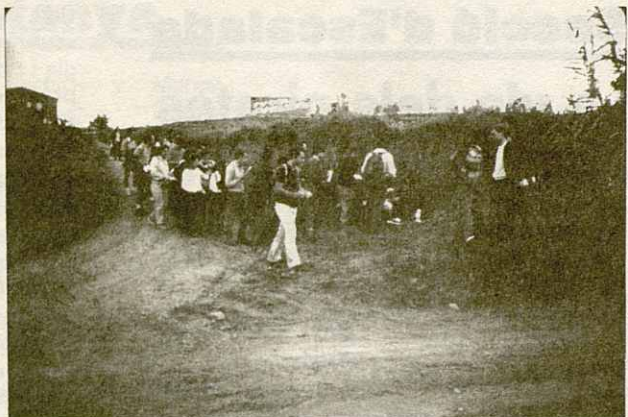
Serra de Llevant