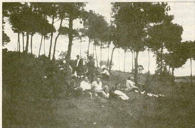
Esmorzar al bosc de Can Maiol