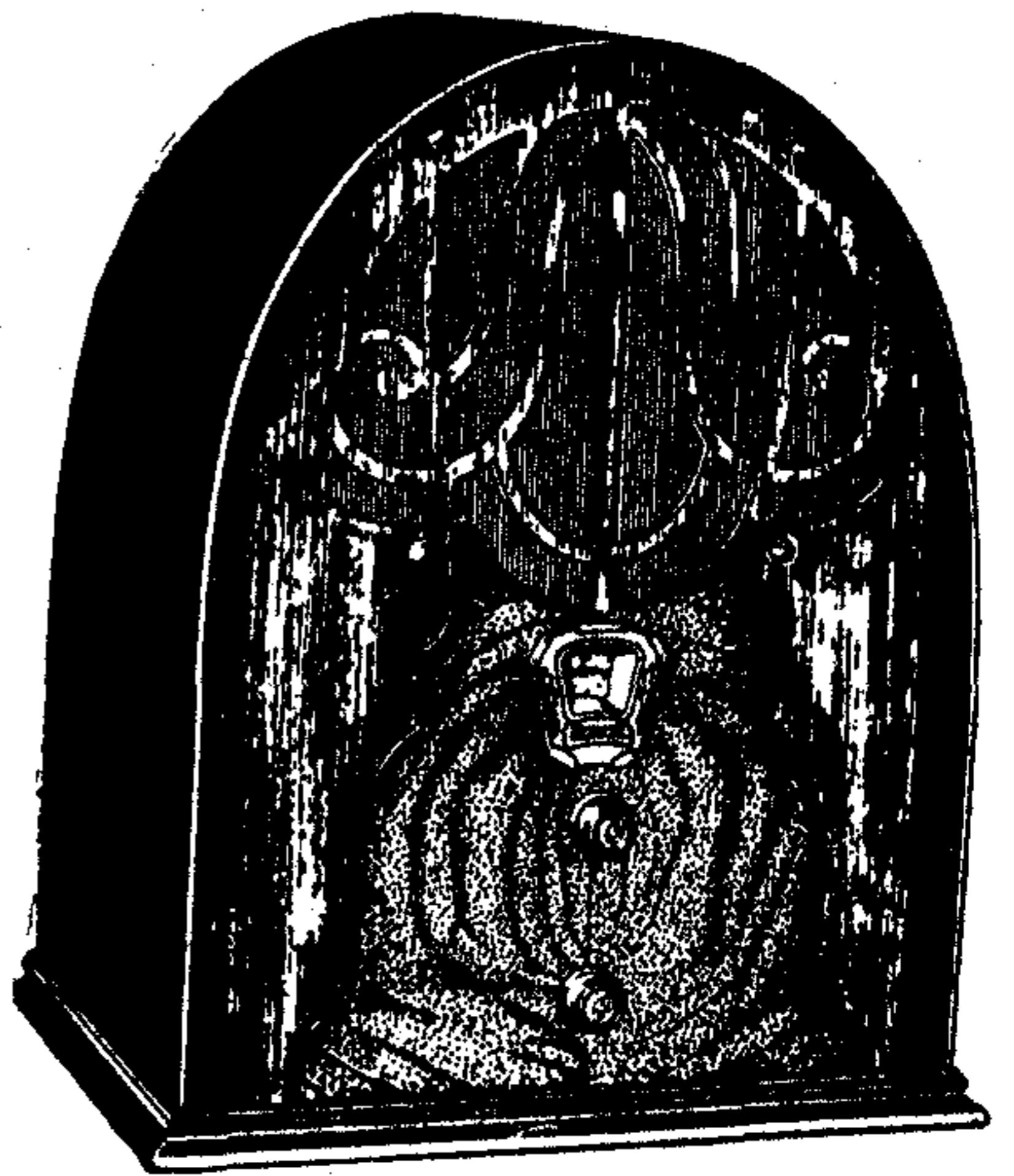
Model 40, de 5 vàlvules

Model 40 —Amb circuit Neutrodí ultra-modern a base de les vàlvules Multi-mu i Pentodo , dotat de tots els perfeccionaments i equipat amb el famós altaveu dinàmic TCA , amb 98 % de puresa de to.