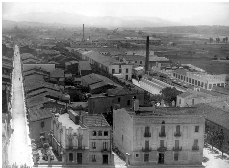
Vista panoràmica de Granollers des de l'església de Sant Esteve, amb la fàbrica de Can Comas a la dreta, l'any 1946.

L'any 1959 es crea el grup empresarial Unión Industrial Textil SA, Unitesa, fruit de la fusió de diverses empreses que integren el Grupo Muñoz i que seran absorbides per Sobrinos de Juan Batlló SA. Aquestes empreses, a part d'Hilados y Tejidos Comas SA, seran: Unión Industrial Algodonera SA, Fábricas Muñoz SA, Algodonera del Pilar SA, Hilados Madurga SA i