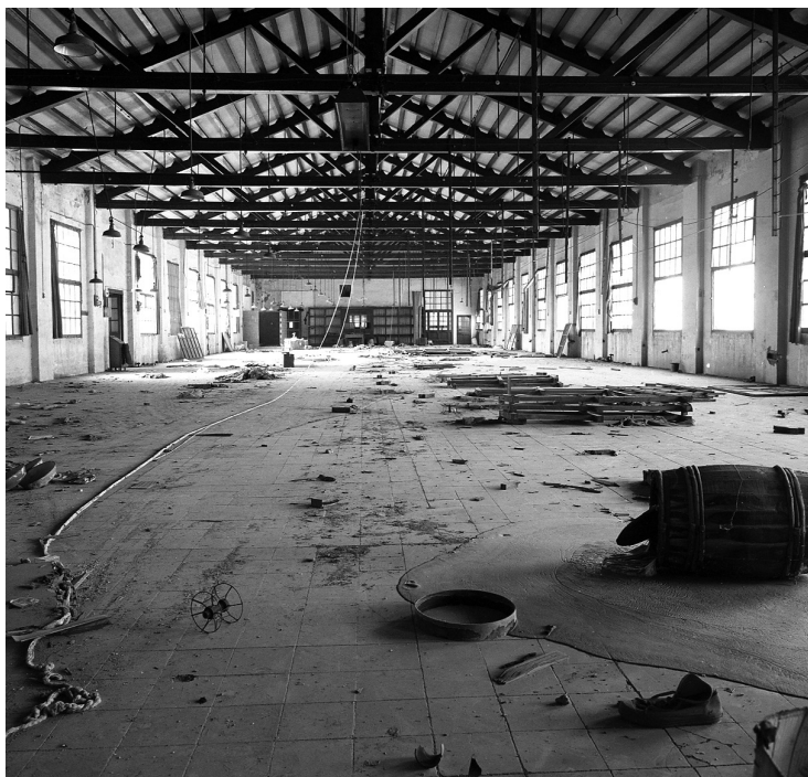
Interior d'una nau abandonada de la fàbrica de Can Comas, l'any 1986.

Ponències Revista del Centre d'Estudis de Granollers, 22 (2018), 163-177