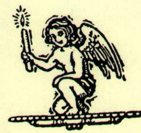
MARE DE DEV DE LA CANDELA

Puix sou Vós qui la Candela porteu sempre en vostra mà: Sieu llum pel nostre poble des del vostre bell altar.