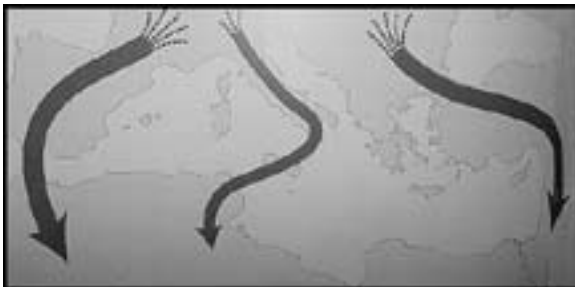
Fig. 3. Principals rutes migratòries de les espècies europees

La migració de qualsevol espècie animal consisteix en el desplaçament de llarg recorregut amb l'objectiu principal de trobar aliment, i no per fugir del mal temps, ja que la majoria d'espècies estan adaptades a aquests canvis de climatologia. A la primavera i l'estiu, els biomes temperats són molt més productius que a l'hivern. Per tant els moviments migratoris es situaran a la primavera i a la tardor, principalment. Adaptades a les necessitats de cada espècie, podem trobar diferents tipus de migració: estival, hivernant, parcial (quan una població d'una espècie sedentària augmenta amb l'arribada d'exemplars a l'estiu o a l'hivern), de pas (espècie present en un territori solament durant els moviments migratoris), en llaç (espècie present solament durant un dels moviments migratoris) o altitudinal. Aquest últim tipus de migració és típic d'espècies alpines i consisteix a descendir d'altitud a l'hivern, per tal d'evitar la neu, que els impedeix accedir a les poques fonts d'aliment que hi ha a l'època.