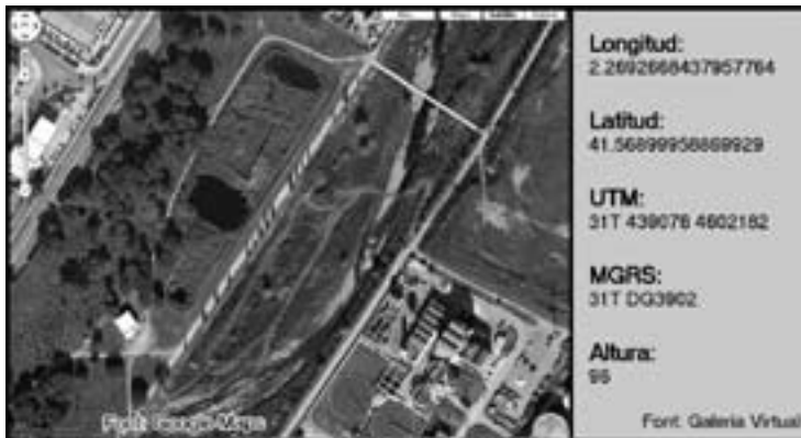
Fig. 1. Localització exacta de l'espai natural de can Cabanyes

Centre d'Educació Ambiental, on es duen a terme diverses activitats educatives, i també informació sobre el lloc, una zona de pícnic i diversos panells informatius en diferents punts de la zona.