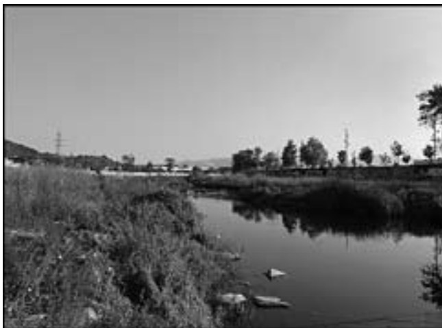
Fig. 2. El riu Congost a Granollers

Ja fora de l'Espai Natural de can Cabanyes, però sense perdre interès biològic, ja que condiciona la fauna d'aquest, trobem el riu Congost (fig. 2). Les espècies més abundants són la polla d'aigua ( Gallinula chloropus ) i l'ànec collverd ( Anas platyrhynchos ), encara que hi podem trobar, en menor abundància, altres espècies: el bernat pescaire ( Ardea cinerea ), fàcilment localitzable a l'hivern, el martinet blanc ( Egretta garzetta ) i gran diversitat d'aus passeriformes com ara la cadenera ( Carduelis carduelis ), el trist ( Cisticola juncidis ) o el repicatals ( Emberiza schoeniclus ), que ens visita a l'hivern. Respecte a la vegetació del riu, hi podem trobar dues zones clarament diferenciades: els herbassars i el canyissar. Als herbassars es situen arbres com el pollancre ( Populus nigra ), l'om ( Ulmus minor ) o el salze ( Salix alba ), arbustos com l'esbarzer ( Rubus ulmifolius ), tomateres ( Solanum lycopersicum ) i diferents plantes herbàcies.