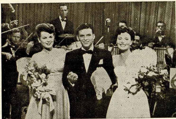
El ídolo del público americano, Frank Sinatra , junto con las artistas Bárbara Hale y Michele Morgan, en la película de R. K. O. Radio Films «Higuer and Higher»

tro de lo trascendental. Múltiples aspectos del vivir de nuestros tiempos están exentos de trascendentalismos, y sin embargo, los aceptamos sin aspavientos ni muestras de desagrado. Buscando una analogía, por ejemplo, encontramos diversos de estos aspectos en que lo artístico manifiéstase abiertamente y sin embargo nadie osa disculpar y menos desprestigiar. El cartel publicitario, la decoración, el anuncio de prensa, el folleto, el escaparate, la exhibición, la presentación de un producto, el programa radiofónico, etc., realizados con verdadero sentido artístico, son ya para nosotros temas tan dignos como el cuadro, la escultura, el monumento, el libro o la obra escénica. El espíritu gregario de nuestras multitudes asimila con pasmosa intuición y comprensión los aspectos más dispa-