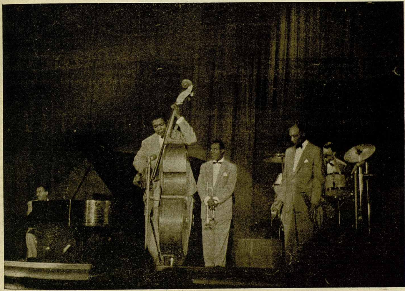
Un momento de las actuaciones de Louis Armstrong y su all-stars en el Windsor de Barcelona