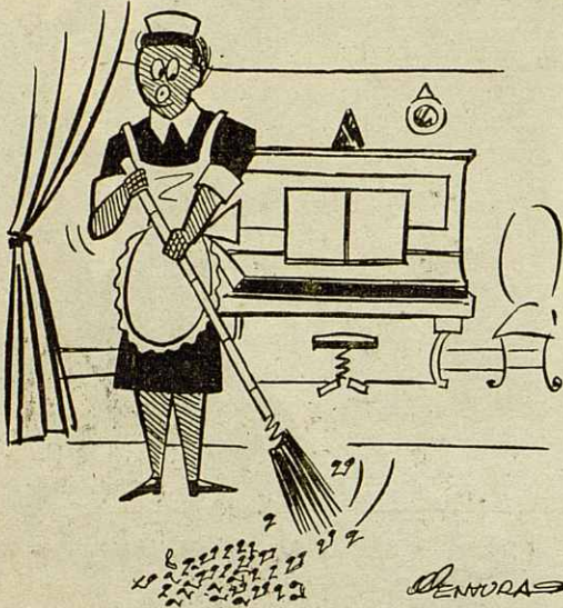
El trabajo de la sirvienta en casa del compositor