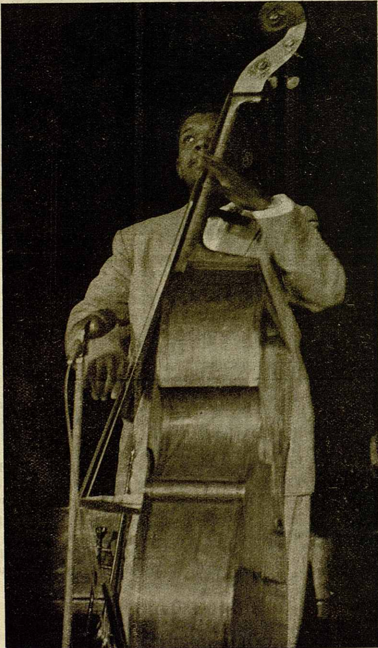
Arvell Shaw en el Windsor Palace

¿Qué les voy a decir del gran Satchmo que no hayan dicho ya mil