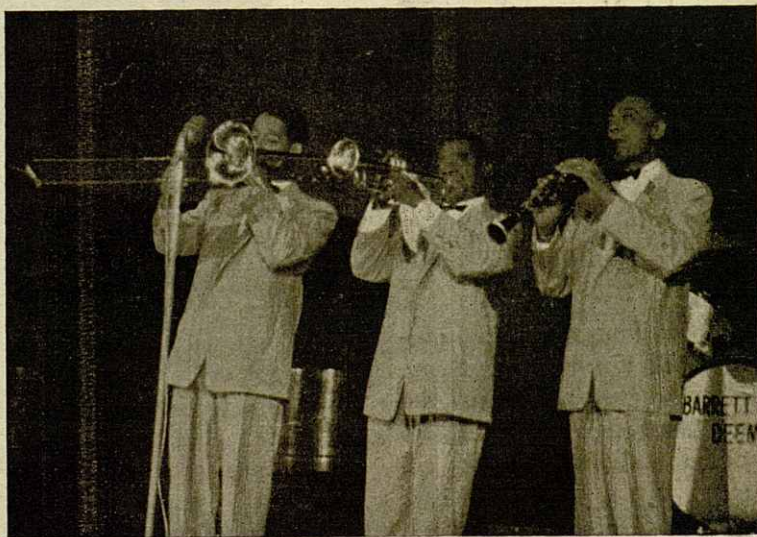
El trio central del grupo de Louis Armstrong en acción

La mayor impresión la produjo el mismo «Satchmo» que tanto tocando la trompeta o bien cantando estaba siempre por encima de sus acompañantes. No fué una estrella de luz falsa, sino sencillamente un trompeta de un original grupo de Jazz. Su figura recordaba a su modelo «King Oliver». 30 años atrás tenía Louis la misma formación y recordamos los «Hot Five» y «Hot Seven» y en los grupos de Jazz clasicistas o melódicos. Hoy tiene un «Hot Six» con el que toca en parte las mismas piezas de otros tiempos y no perjudicó de ninguna manera al ejecutar el «Blueberry Hill» o «C'est si bon». El viejo devoto de Louis Armstrong ama las piezas de todo tiempo. Porque cuando le llamamos «Rey del Jazz» no deseamos sus agudos.