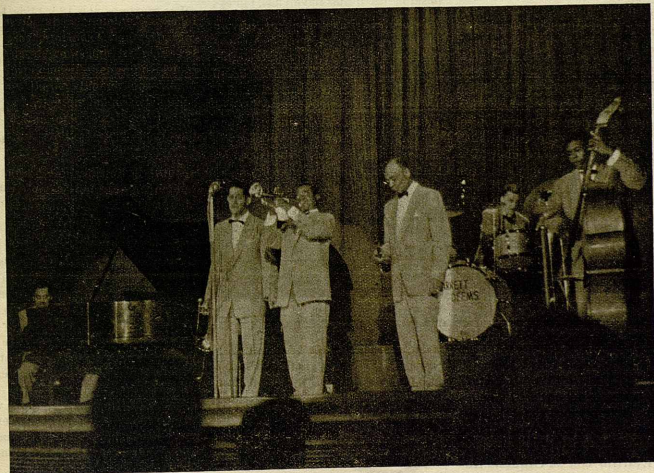
Louis Armstrong y su grupo all-stars en Barcelona