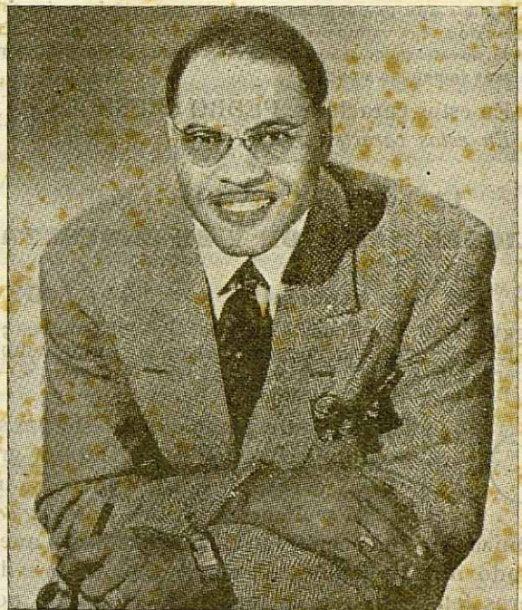
Ivory Joe Hunter

Ivory Joe nació en Texas y fué huérfano desde muy joven. Su hermana mayor tomó entonces el mando de la familia y enseñó a sus hermanos a ganarse el sustento bailando «tap-dancing» y tocando el piano en varios cafés. Fué en estos lugares donde Ivory Joe Hunter y sus hermanos aprendieron a tocar el piano... con pianos desafinados y estropeados. Tan pronto como tuvo edad para trabajar, Ivory Joe dejó la familia para buscar un buen empleo, cosa difícil para los negros en aquellos días... Todo lo que pudo conseguir fueron ocupaciones sin importancia, hasta que le ofrecieron un puesto en una emisora local como pianista boogie woogie, donde consiguió alguna popularidad. Su salario era insuficiente y para subsistir a sus necesidades trabajaba por las tardes como descargador del muelle. Fué entonces que organizó un quinteto y se dió cuenta de que aquello era la carrera que necesitaba en realidad. Podía tocar el piano lo suficientemente bien para dejar al público satisfecho, y lo único que le hacía falta era ganarse más admiradores. Con una gran confianza en sí mismo empezó a edificarse un nombre en los círculos musicales, hasta que se trasladó de Texas a Cali-