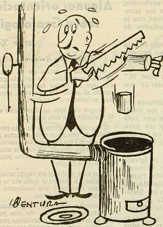
Los grandes maestros del violín