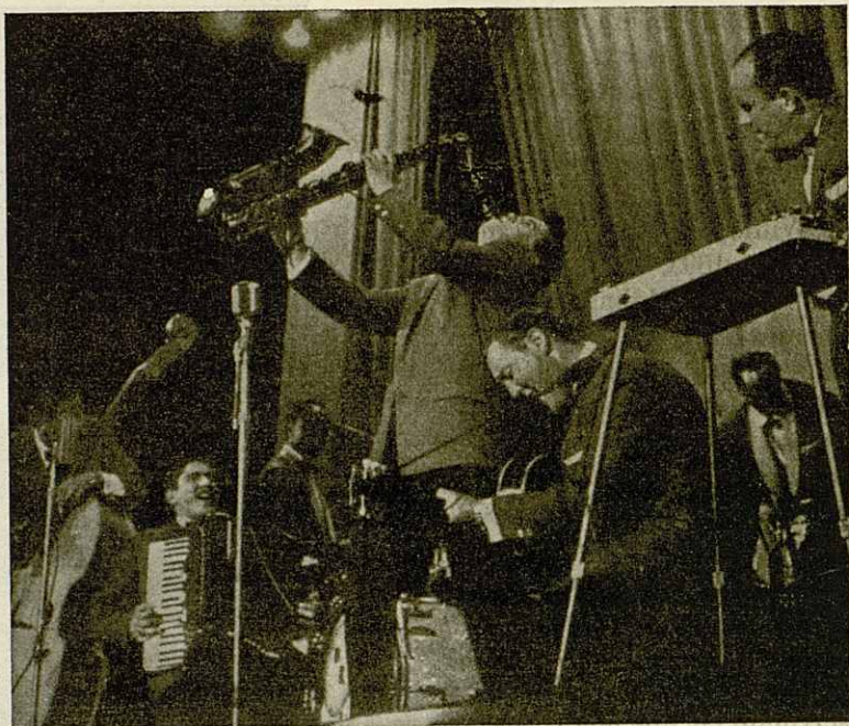
Rock 'n' Roll

Para que nos demos cuenta de lo que significa una sesión de Rock 'n' Roll, seguidamente traduzco una noticia leída en la revista francesa «Jazz Magazine»: «Intentando cantar más fuerte que un público que vociferaba salvajemente, Tony Bennet, perdió la voz desde la segunda noche. Du-