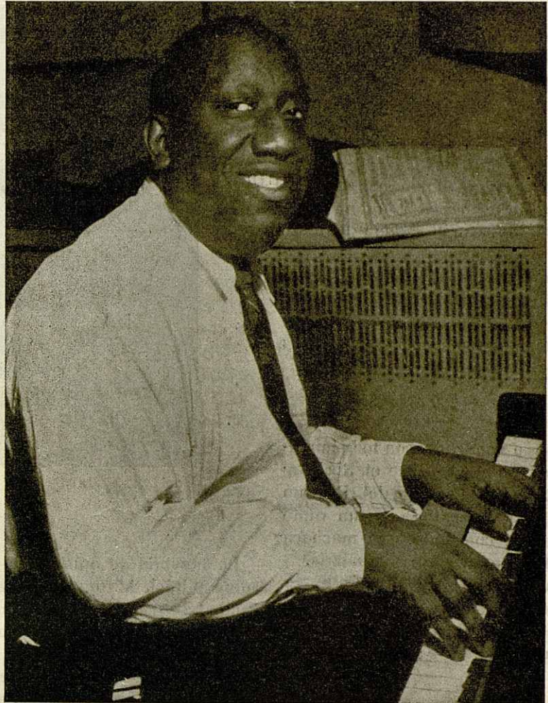
James P. Johnson

Y como acompañante de cantantes nadie ha sobrepasado a James P. Sus discos con Bessie Smith y Ethel Waters quedarán como modelo del género. Que acompañe a Bessie en el blues lento Back Waters blues , Worn out Papa blues , Dirty no gooder's blues ; en el blues rápido It makes my Love come down ; o que acompañe a Ethel Waters en encantadoras melodías como My Handy Man , Guess who's in town , Do what you did Last night , su parte de piano for-