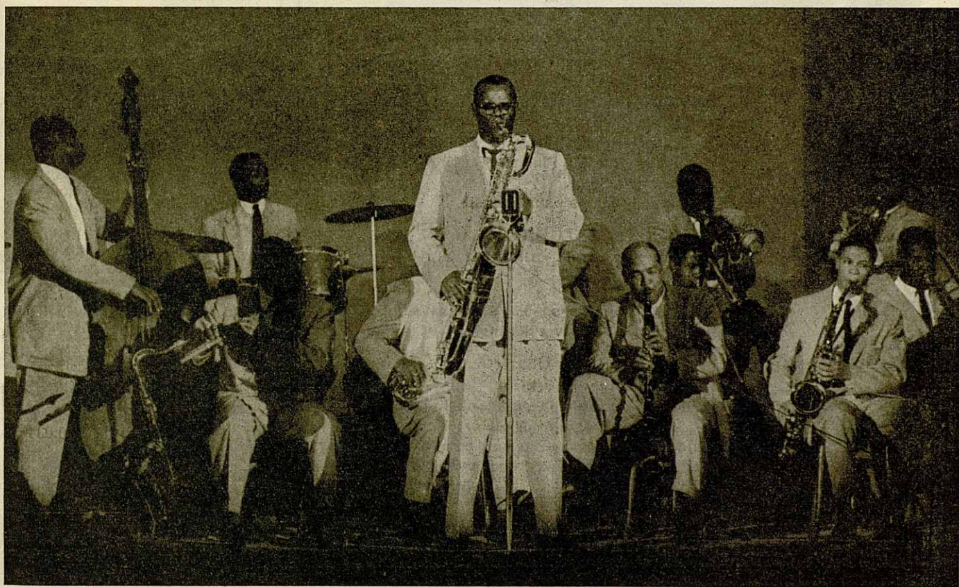
El saxofonista Charlie Fowlkes, en uno de los mejores momentos del concierto