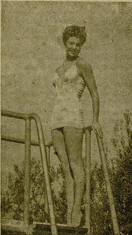
La encantadora estrella Esther Williams

Las carteleras anuncian, al fin, la grandiosa producción Metro Godwyn Mayer en tecnicolor «Escuela de sirenas», de la que es protagonista la escultural Esther