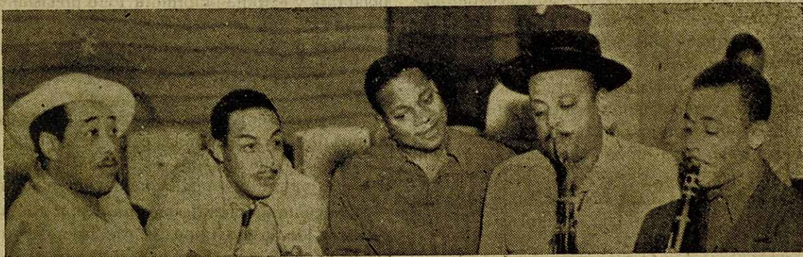
Ben Webster ha regresado al Dukedom, y Johnny Hodges lo ha dejado para formar su propia orquesta. Pero antes de la marcha de Hodges fué tomada esta fotografía, durante un ensayo para el reciente concierto del Carnegie Hall. (De izquierda a derecha: Ellington, Hodges, Harry Carney, Webster y Jimmy Hamilton)

El nuevo bajo Wendell Marshall, primo del ex-hajo de Ellington, Jimmy Blanton, hizo su debut con el otro opus de Mercer Ellington, She Wouldn't Be Moved . Usan-