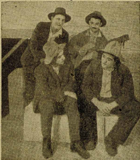
Los celebrados hermanos Mills, que de manera tan grata nos han deleitado con sus melodías escrupulosamente escogidas, teniendo siempre esmerado tacto en no caer, en sus elecciones, dentro de la vulgaridad y mal gusto lírico