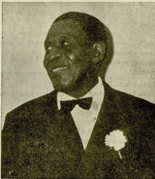
Oscar «Papa» Celestin

grupo que capitaneaba Oscar Celestin, contó en el transcurso de los años con la presencia de los mejores jazzmen de la época. Entre ellos destacan Louis Armstrong, Johnny Dodds, Lorenzo Tio II, Jimmy Noone, Kid Shots Madison, Zutty Singleton y Alfonso Picou. El conjunto era considerado como el mejor y más «hot», tocando en la mayoría de entierros y «parades».