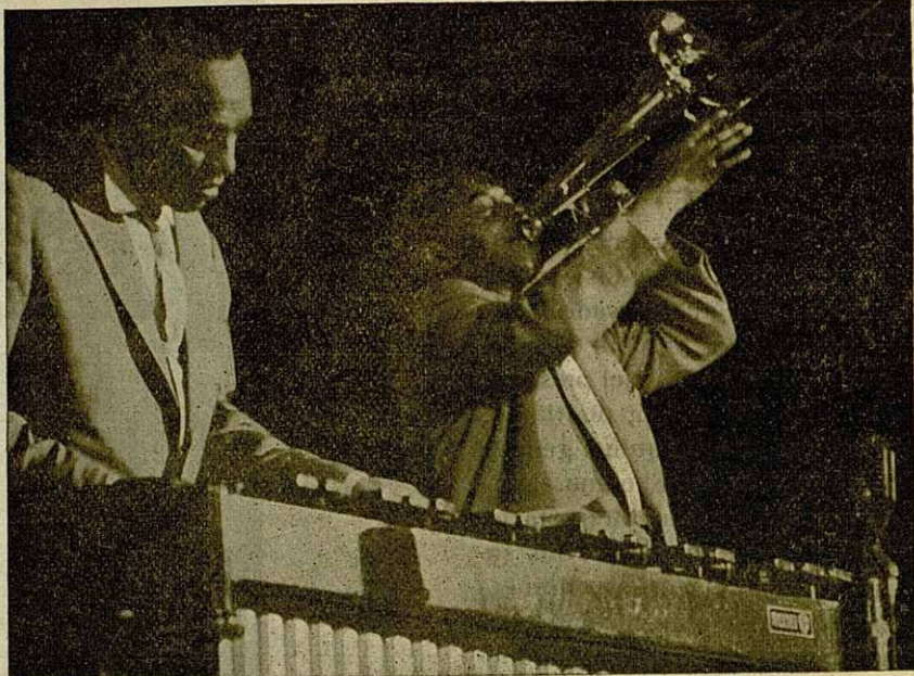
El «Hamp» con Al Hayse

El segundo concierto de Lionel Hampton realizado el día 13 de marzo, será recordado por mucha gente por varios motivos. Dejando aparte la calidad del programa y la virtuosidad de sus músicos—lo cual es tratado y alabado por otras firmas más enteradas—merecen tenerse en cuenta otros factores que tienen su importancia y su ayuda para una captación más intensa por parte de muchos. El ambiente de la sala, por ejemplo. Perfecto y bien dispuesto en todos los momentos, contando aquellos también en los cuales se manifestaba impaciencia cuando no era del agrado público unos rápidos y solos toques de timbales. (A fuer de ser sinceros creo que la mayoría de las veces sobran también los sonidos rítmicos de ciertos instrumentos artificiales, pandere-tas, maracas, tubos, etc., etc.) De todos modos el ritmo estaba asegurado, como es ya ritual en Lionel Hampton, aunque saliese de uno de los