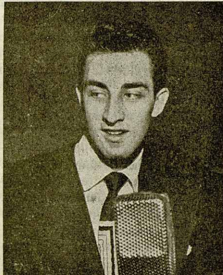
BUDDY DE FRANCO que ha conseguido el mayor número de votos