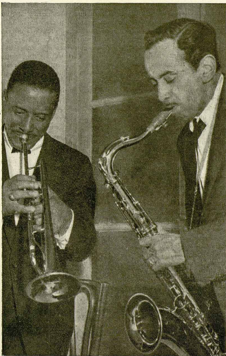
Ray Nance y Paul Gonsalves

Empieza la segunda cara con Up Pasa a la página 7