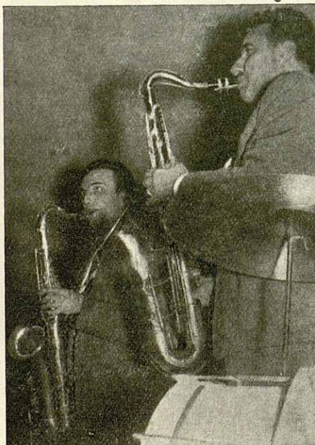
A. Torrents y «Manteguilla»

Únicamente nos resta felicitar a los organizadores por el esfuerzo que, sin duda, tuvieron que realizar para poderlo llevar a cabo, y que el éxito artístico conseguido estimule a nuestros músicos a tomar parte en espectáculos de esta índole.