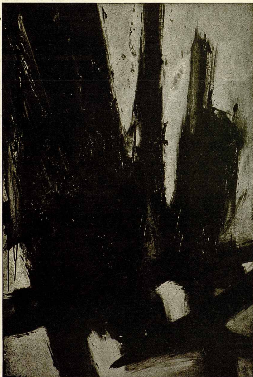
Primer premio de Pintura

Este pintor, uno de los más sobresalientes entre el grupo magnífico de nues-