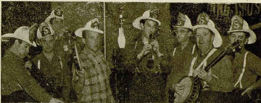
Fire House Five

Cuando hubo el renacimiento «New Orleans» tímido en principio (1938) y mucho más marcado a partir de 1944,