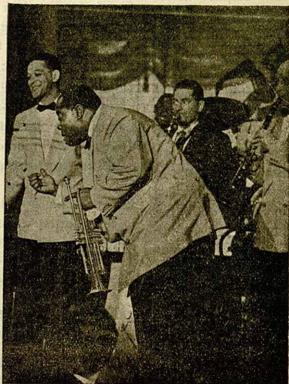
Louis Armstrong con Barney Bigard y Trummy Young

El único fallo en estas grabaciones, bastante importante para tenerlo en cuenta, es la actuación del clarinetista Jimmy Hamilton, al que no comprendemos como Duke le ha incluido durante tantos años en su conjunto. Téngase en cuenta que esta opinión