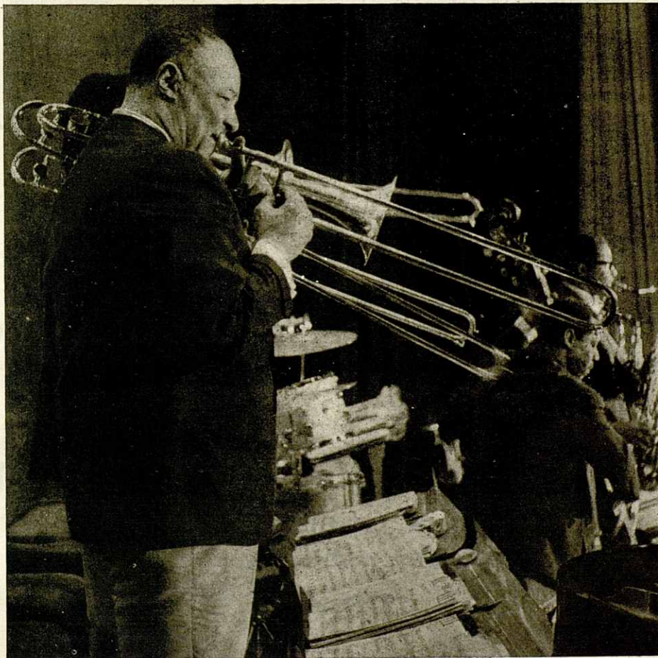
Un momento del concierto, con Quentin Jackson en primer plano