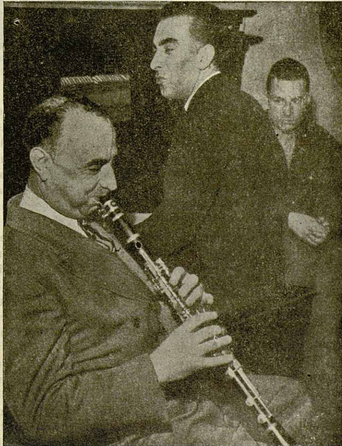
Milton "Mezz" Mezzrow

Termina este libro con el capítulo «Hacia la tierra del jazz»; cuando en octubre de 1938 recibe una carta de su amigo Mezzrow indicándole que aquel es el mejor momento para cumplir su deseo de visitar la tierra del jazz, le decide a embarcarse para New York.