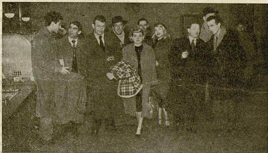
Algunos componentes de la Graeme Bell Australian Dixieland Jazz Band fotografiados conjuntamente con los Harlem Be Bop Dancers (Francia), que tomaron parte como atracción en los conciertos celebrados en Berlín en 1952