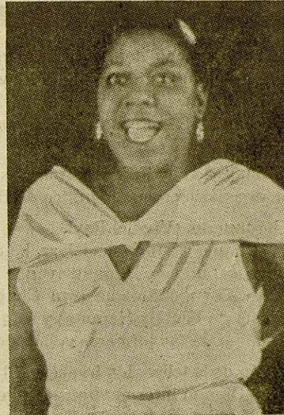
Bessie Smith, la malograda intérprete del Blues, máximo exponente femenino del auténtico jazz en la época de oro del mismo

jambre. Pobres y limitados snobs en su más mísera consecuencia. Ni siquiera les queda la justificación de hacer fructífera, con su apoyo, la obra de arte. Todo su entusiasmo está encaminado hacia lo vulgar, sin categoría artística, deslumbrados por el brillante (?) cascarón vacío de los Shaw, Dorsey, Miller, Ambrose, cuando no ululando