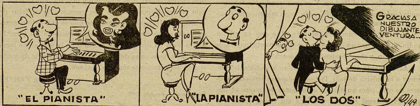
EL DUO DE PIANO, por Ventura