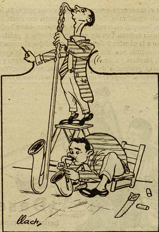
Cómo imagina el público, la definición de saxo alto y saxo bajo.