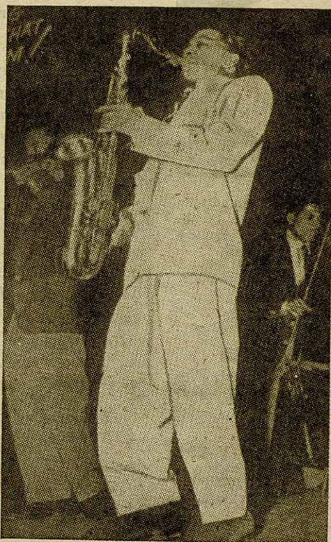
Illinois Jacquet, el celebrado saxofonista, en una de sus clásicas actuaciones en JATP.

Poco tiempo después fué requerido primeramente por Cab Calloway y después por Count Basie. Durante su estancia en la orquesta de Count, grabó: Stay Coal, La-