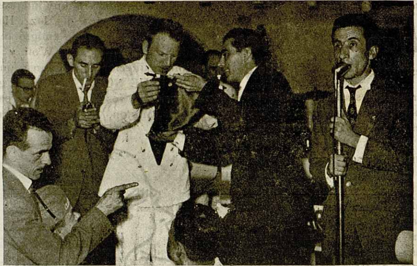
Momento de la entrega del banderín a los marinos pertenecientes a la VI Flota norteamericana

la noche tuvo lugar el tradicional Baile de Ramos a beneficio del Hospital-Asilo, de nuestra ciudad, cuya recaudación íntegra es entregada a la benéfica institución.