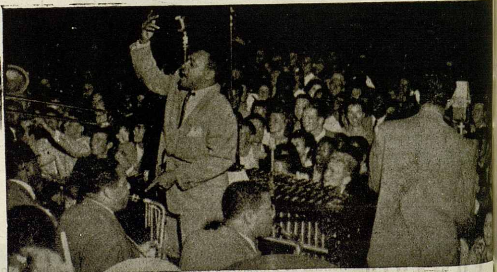
Orquesta Lionel Hampton