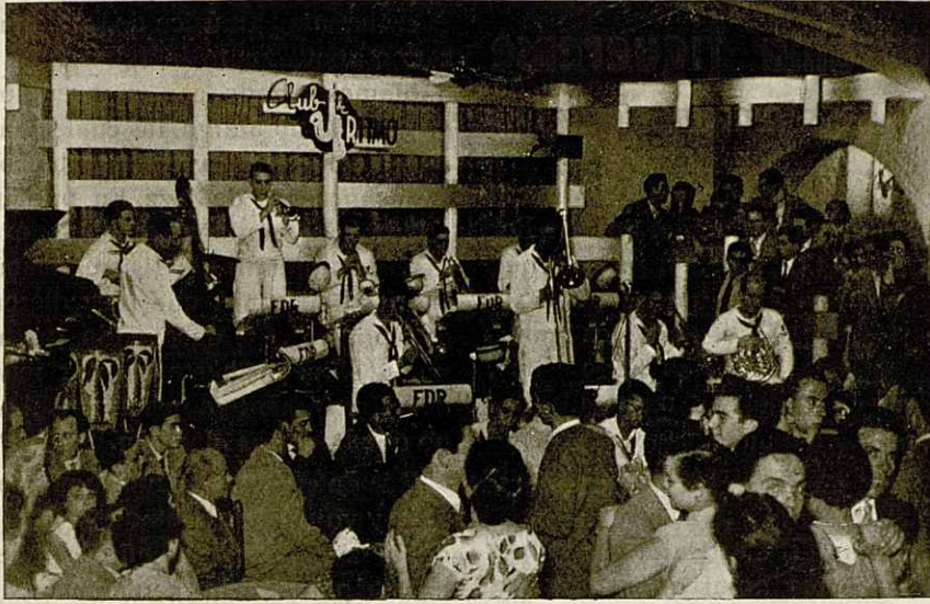
Un aspecto de la sala durante el baile en el que actuaron la Banda de Música del portaaviones Franklin D. Roosevelt y la orquesta Selección