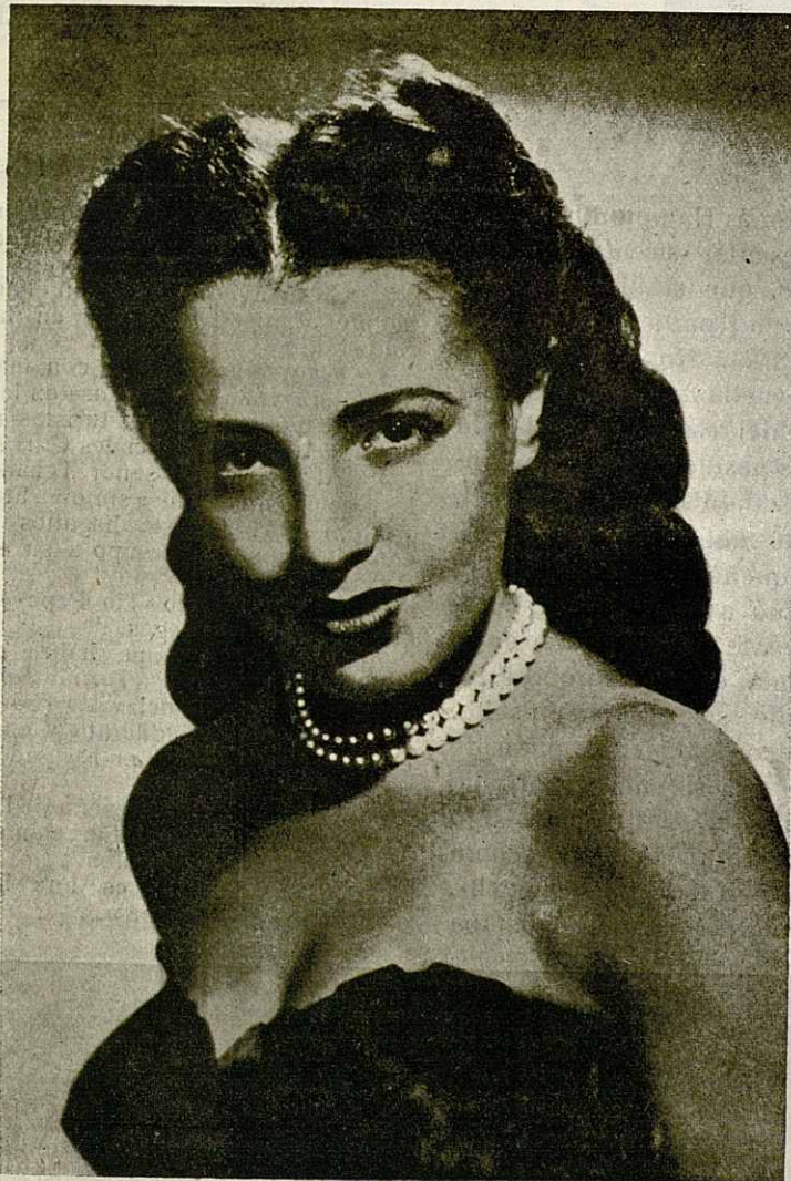
MADLYN RUSSELL, de 23 años, que hizo sus primeras armas como vocalista en la orquesta de Vaugh Monroe, está alcanzando gran popularidad como estrella solista en la grabación de discos

Granollers, Septiembre de 1953 - Núm. 89