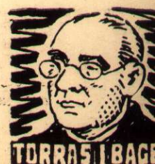
TORRAS I BAGES