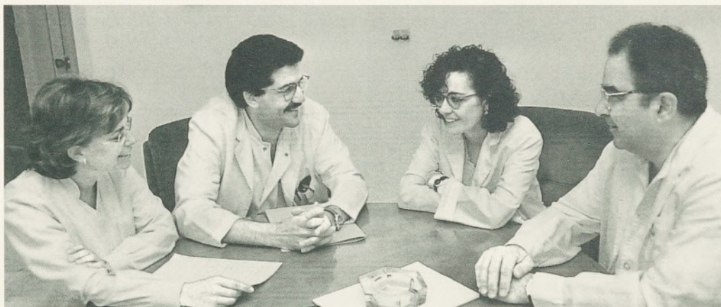
L'equip directiu assistencial es mostra convençut dels avantatges de treballar per UPA.

AP: No crec que ara haguem de menysvalorar l'organització hospitalària vigent. Aquest model ha estat vàlid durant més de 25 anys i ha fet que el nivell assistencial de l'estat sigui homolo-