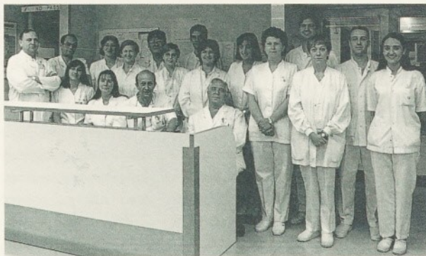
Una part de l'equip de l'Àrea Obstètrica.

Quant al control del fetus, l'Àrea Obstètrica disposa d'un sistema de control bioquímic que ens serveix per controlar si està tolerant bé el treball del part. Aquest control es fa mitjançant una anàlisi de sang que ens dóna el pH, la qual cosa ens ajuda a eliminar dubtes sobre possibles patiments del fetus.