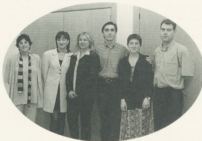
Els nous especialistes comencen un nou camí en la seva vida professional.