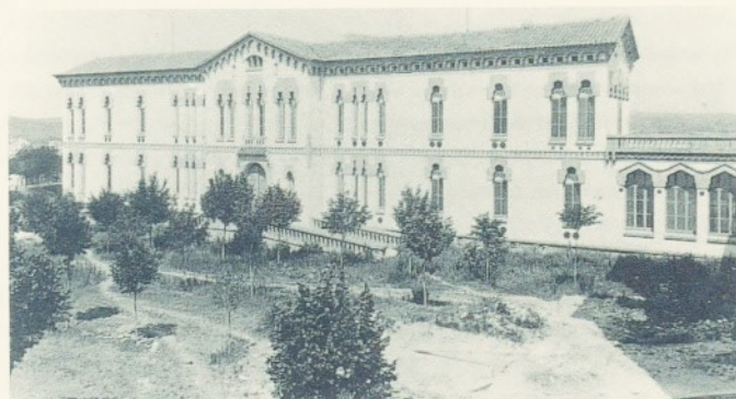
No fa massa anys l'hospital oferia aquesta imatge.

A partir del segle XVI, el municipi es va fer càrrec de la seva administració i del seu manteniment. No sembla pas, però, que amb aquest canvi s'aconseguís un millor finançament i un progrés en l'atenció als necessitats. La ubicació d'aquest primer hospital va ser l'antic convent de Sant Domènec, al carrer de Corró, actualment biblioteca popular Francesc Tarafa.