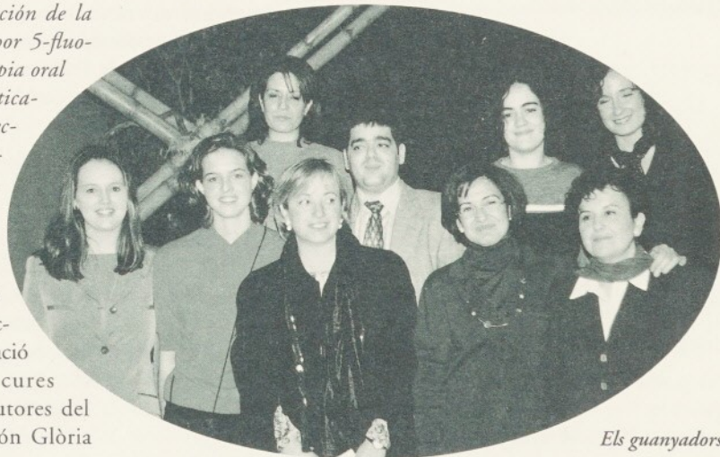
Els guanyadors del Premi.