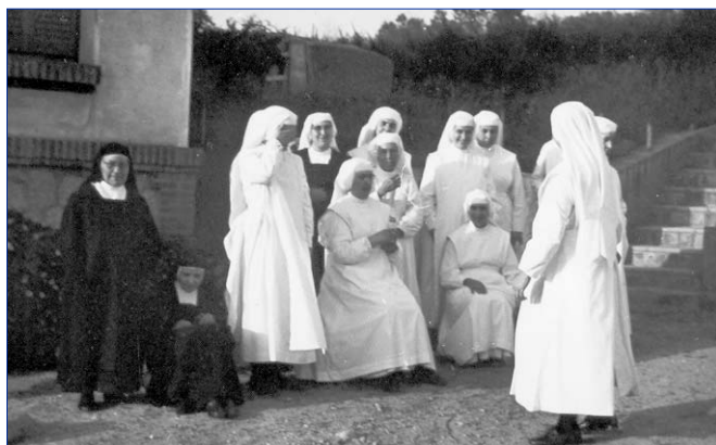
Una foto històrica de les germanes carmelites de l'Hospital