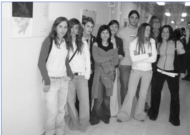
Alumnes del Celestí Bellera, autors de l'exposició de fotografies

I tu, com ho veus? és fruit de l'empenta de diverses persones de l'Hospital i de la il·lusió i el treball de professors i alumnes de l'IES Celestí Bellera de Granollers. Aquesta exposició forma part del projecte Hospitalart, emmarcat en l'Observatori de la Salut Dr. Carles Vallbona, que té com a objectiu establir lligams entre l'art i la salut, entre els artistes, els malalts i els professionals. Durant uns dies, les sales d'espera i els passadissos de l'Hospital es van convertir en un espai diferent