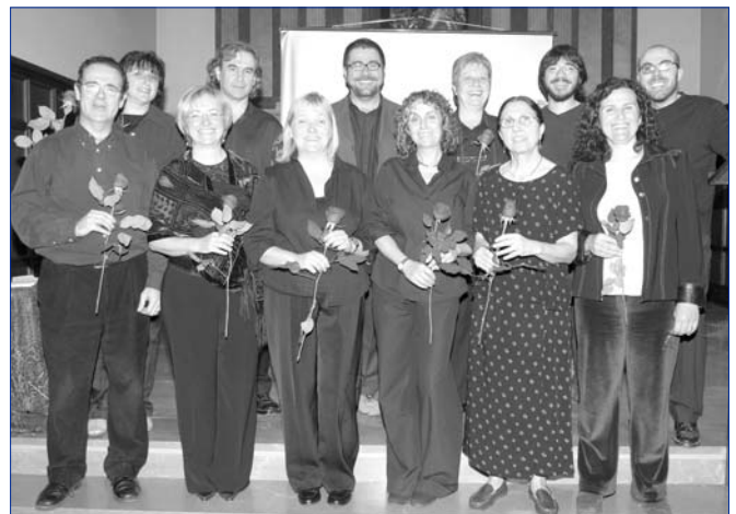
Companys i companyes de l'Hospital van participar en el recital de poemes