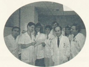
L'equip del Servei de Diagnòstic per Imatge.

Aquest pòster tracta de les variants anatòmiques dels recessos superiors del pericardi en els nens, que poden donar origen a falses