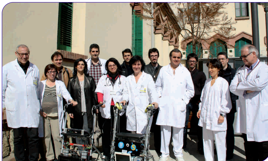
Fotografia del grup de professionals de l'Hospital que participen en el projecte europeu "I-DONT-FALL"