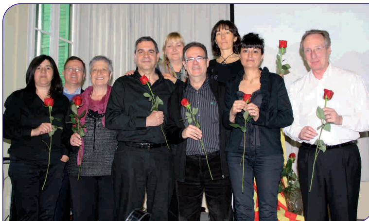
Diversos treballadors de l'Hospital van fer, com ja és tradicional, una lectura de poemes

Com cada any els treballadors de l'Hospital General de Granollers van organitzar diverses activitats per commemorar la diada de Sant Jordi. Aquest any, com a novetat, es va engegar la I Marató de donació de sang dirigida a tots els professionals de la institució. Totes les persones que van ser donants van rebre un llibre i una rosa, cortesia de Vivers Ernest. Per altra banda, també es va celebrar el tradicional recital poeticomusical, una activitat cultural on alguns professionals fan una lectura de poemes amb l'acompanyament d'un músic.