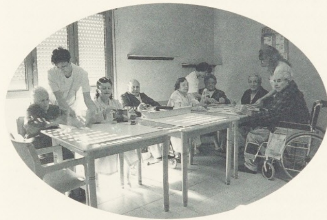
Sala d'estar de Convalescència.

L'any 1986 es va crear el Programa Vida als Anys (PVA). Aquest programa es va iniciar al Departament de Sanitat i Seguretat Social i es finançava mitjançant l'aportació de l'Institut Català de la Salut (ICS) i l'Institut Català d'Assistència i Serveis Socials (ICASS).