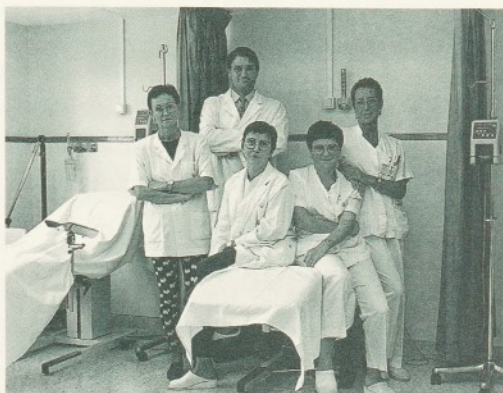
L'equip de la Unitat d'Oncologia.

Abans de posar en marxa aquesta renovació, l'equip d'Oncologia va fer un estudi entre els seus pacients per conèixer quins