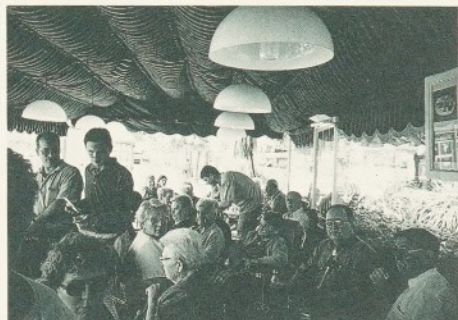
Sortida dels residents a Palamós