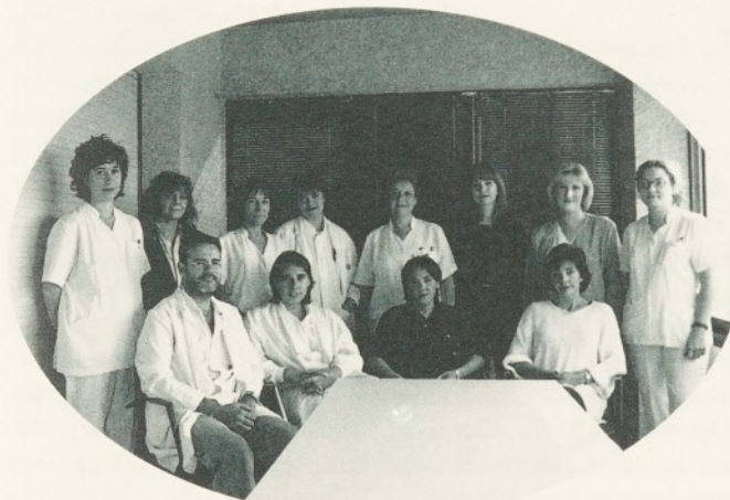
Les cures pal·liatives pretenen promoure la màxima qualitat de vida mentre aquesta existeixi.

Els equips hospitalaris de cures pal·liatives neixen de la constatació de l'alta prevalença de malalts terminals als nostres hospitals. D'altra banda, en el