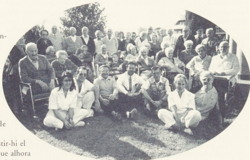
Tots junts vàrem gaudir d'uns dies de festa.