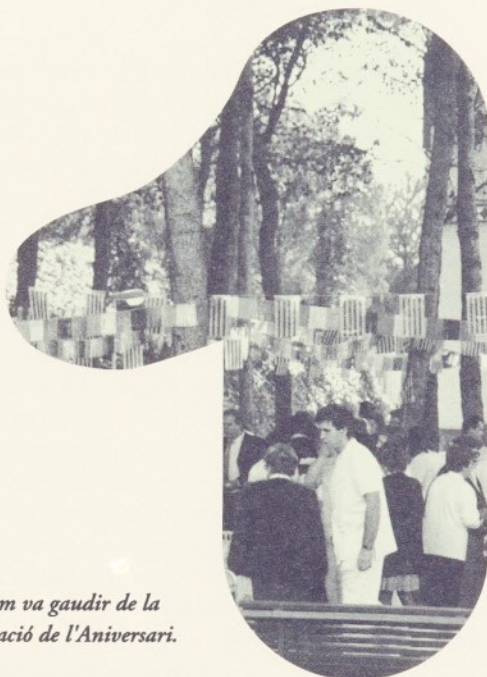
Tothom va gaudir de la celebració de l'Aniversari.

Periòdic de la Fundació Hospital/Asil de Granollers