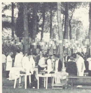
L'aperitiu va ser un acte molt concorregut.