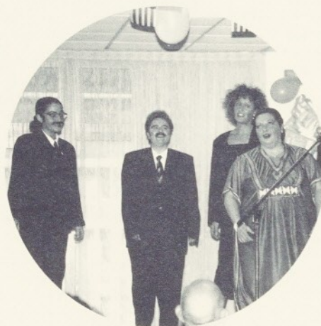
Les actuacions van ser uns dels aspectes més celebrats.