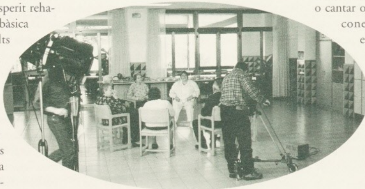
Moment del rodatge d'un grup de pacients