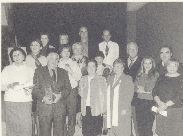
Companys i companyes que van rebre un record especial.