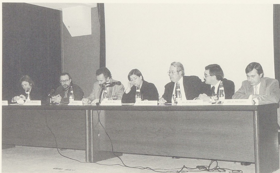
Moment de l'acte de presentació de la UDEN.