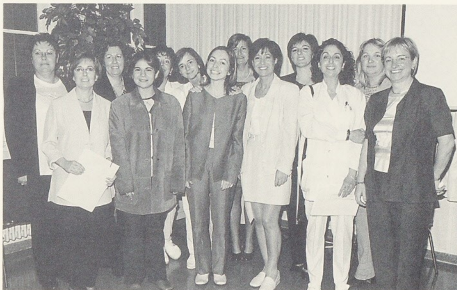
Les guardonades amb els premis a la Formació Contínua.