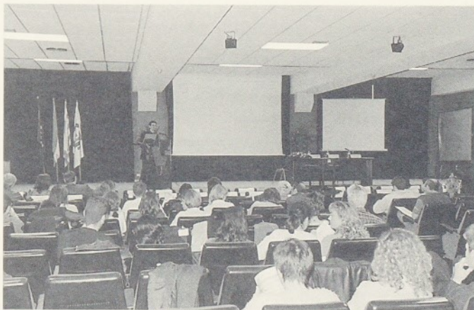
La sala d'actes del Centre Geriàtric acollí la Sessió.

El dia 9 de maig es va dur a terme, a l'Hospital General de Granollers, la Sessió d'Hospitals Comarcals de la Societat Catalana de Citopatologia, organitzada pel Servei d'Anatomia Patològica. Aquestes sessions formen part dels programes acadèmics anuals de l'esmentada Societat.