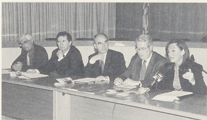
Presentació prèvia a la signatura del conveni.

Aquest conveni entre la Universitat de Vic, l'Ajuntament de Granollers i la Fundació Hospital/Asil de Granollers preveu establir una oferta d'estudis de postgrau en aquesta especialitat amb seu presencial a la ciutat de Granollers, i concretament a les aules de l'Hospital. El Màster s'iniciarà al curs acadèmic 2001/2002 i tindrà caràcter bianual.