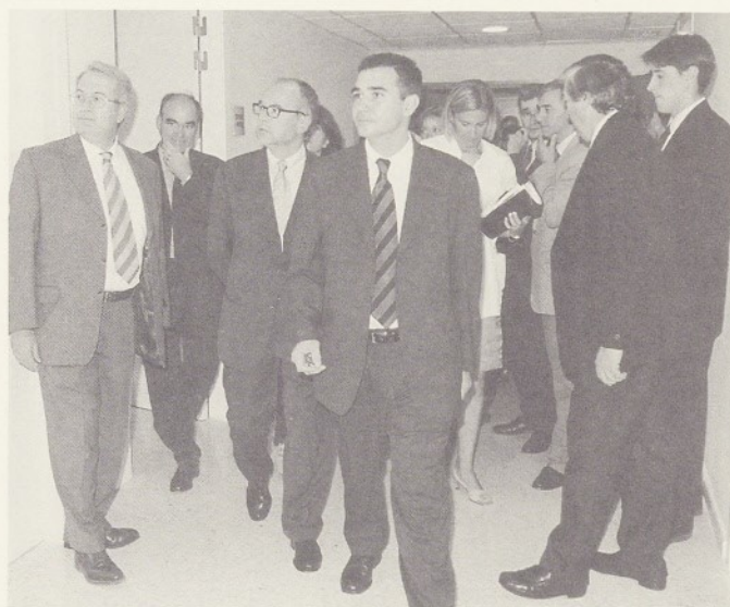
Visita a la Unitat de Psiquiatria.

Aquests equipaments constitueixen una primera fase de l'acord que van subscriure, al mes de juny de l'any passat, el Servei Català de la Salut, el Complex Assistencial de Salut Mental Benito Menni, l'Ajuntament de Granollers i la Fundació Hospital/Asil de Granollers. Aquest acord té com a objectiu principal coordinar el desenvolupament dels serveis i equipaments d'atenció psiquiàtrica i salut mental d'adults a Granollers i la seva àrea d'influència. Queden pendents de desenvolupar els serveis de subaguts i alta dependència psiquiàtrica.