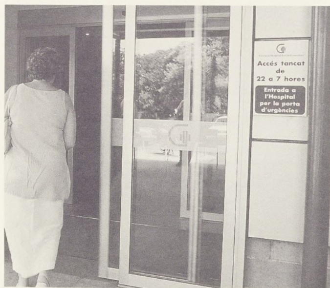
La porta principal romandrà tancada de les 22 a les 7 hores.

Des del passat 18 de juny s'ha reforçat la seguretat al nostre Hospital, amb la incorporació de dos vigilants de seguretat i amb noves mesures que han modificat el circuit d'entrada i de sortida del públic durant la nit.